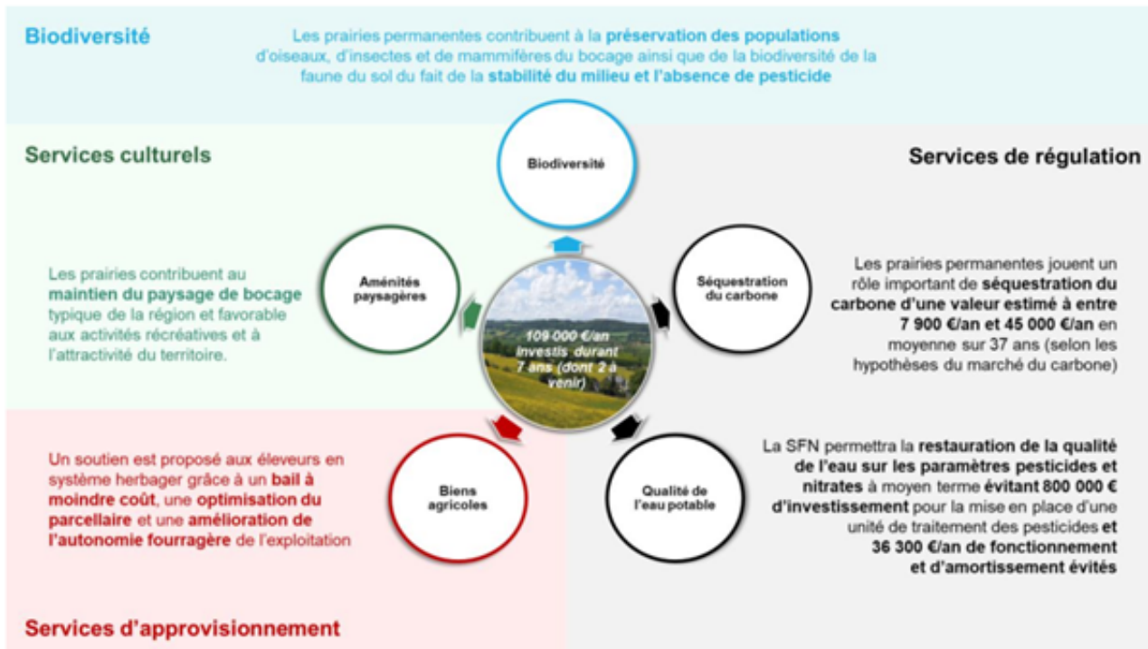
Figure 14 : Présentation synthétique des principaux services écosystémiques permis par la SFN