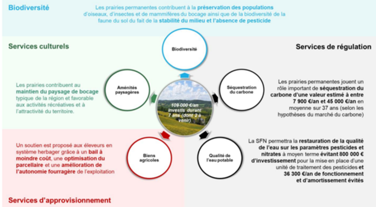
Figure 14 : Présentation synthétique des principaux services écosystémiques permis par la SFN